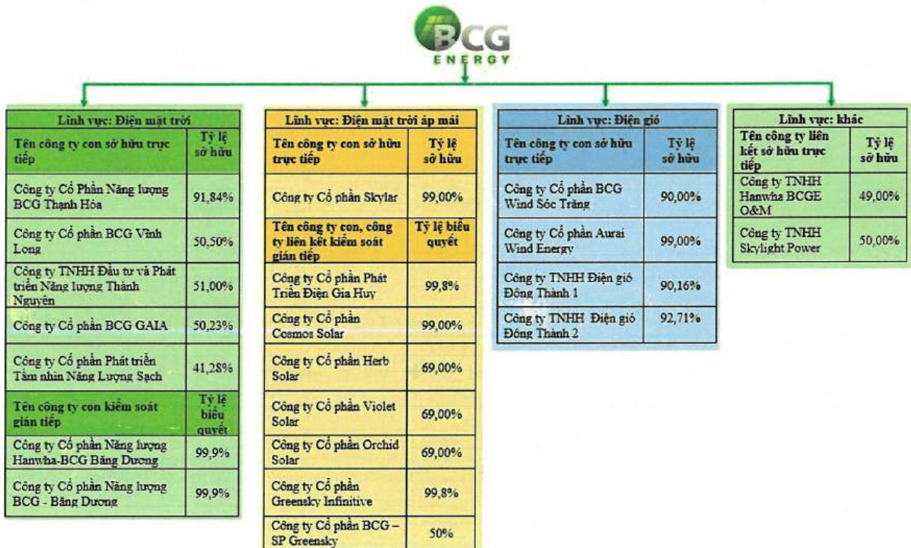
Hình 1. Sơ đồ cơ cấu tổ chức của Công ty tại thời điểm 31/12/2023

Cơ cấu Công ty Cổ phần BCG Energy và các công ty con/công ty liên kết được tổ chức và hoạt động theo Luật Doanh nghiệp số 59/2020/QH14 ngày 17/06/2020 của Quốc hội nước Cộng hòa Xã hội Chủ nghĩa Việt Nam (“Luật Doanh Nghiệp”). Các hoạt động của Công ty và các công ty trong hệ thống tuân thủ Luật Doanh Nghiệp và các Luật khác có liên quan và Điều lệ Công ty được Đại hội đồng cổ đông nhất trí thông qua.